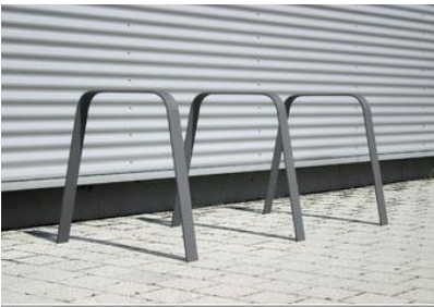
Kreuzberger Bügel Fs 36 (Fa. ABEX):