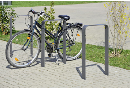
Serie F8 SB 2 (Fa Beck):